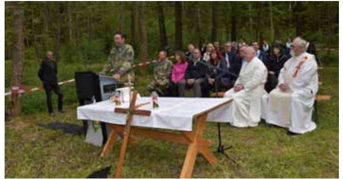
Ansprache bei der Maiandacht in Oberndorf. Auch 2025 eine Veranstaltung mit vielen Besuchern.