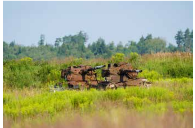
Militär und Natur - beim TÜPI A ganz selbstverständlich.

Die militärische Nutzung des Truppenübungsplatzes Allentsteig ist ein Gewinn für beide Seiten. Einerseits wird Raum für die Truppen geboten, andererseits bietet es vielen Wildtieren und der Fauna Lebensraum. Durch Fahrspuren diverser Militärfahrzeuge entstehen für das Wild zusätzliche Tränkeplätze und Suhlen (Schlammhäder).