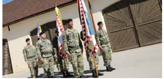
Fahnen und Standarte von TÜPI A, Militärkommando NÖ und der Liechtensteinkaserne waren angetreten.