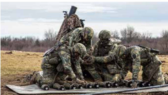
Letzte Vorbereitungsarbeiten zum Abschuss der Granaten.

Einsatz der Logistik: Die logistische Sicherstellung von Munition, Betriebsmittel, Instandsetzung, Bergung sowie Abschub und die Sanitätsversorgung sind ein wesentlicher Bestandteil zur Erfüllung des Kampfauftrages.