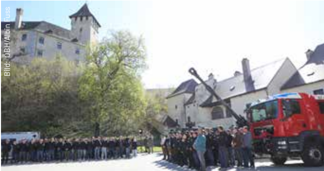
Die Bediensteten des TÜPI A waren angetreten, um Oberst Oberleitner in der neuen Funktion Respekt zu zollen.