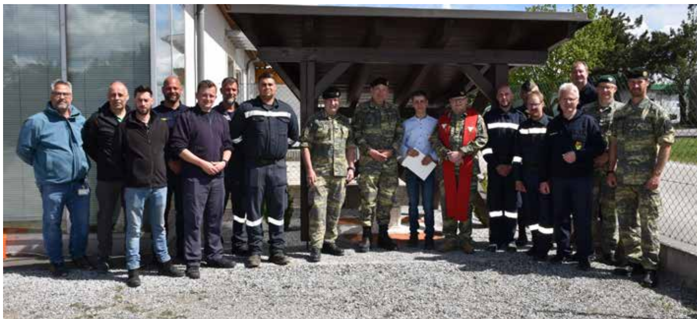
Die Teilnehmer der Messe gedachten dem Heiligen Florian und baten um seinen Schutz.