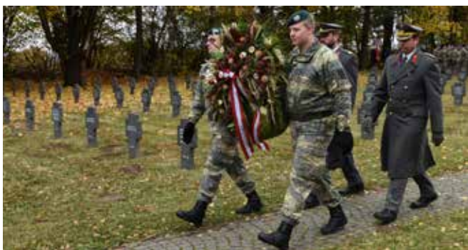
Beim Gedenken zu Allerheiligen am Soldatenfriedhof vertrat er das Österreichische Bundesheer.