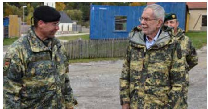
Sicher ein Höhepunkt: Der Besuch von Bundespräsident Van der Bellen. Viele Infos gab es an ihn zu übermitteln.