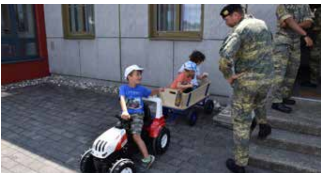
Auch bei der Kinderbetreuung schaute er öfters vorbei. Ein Plauscherl zweier Agrarfacheleute kann schon mal dabei sein.