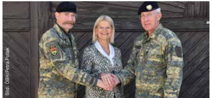
Aus guten Händen wurde die Leitung des größten Übungsplatzes Österreichs in ebenfalls gute Hände übergeben.