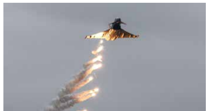
Eurofighter beim Ausstoß von Flares (Leuchtfackeln) am TÜPI A .

In Friedenszeiten können Flares gegenüber abgefangenen Luftfahrzeugen (unautorisierte Nutzer des österreichischen Luftraums) von der Luftraumüberwachungspatrouille jedoch auch als nachdrückliche Aufforderung zur Kooperation sichtbar eingesetzt werden. Sollte das abgefangene Luftfahrzeug nicht auf Funksprüche oder international verlaubliche Zeichen der Eurofighter reagieren, können Flares als Alternative zum Warnschuss (Androhung des lebensgefährdenden Waffengebrauchs) eingesetzt werden und leisten damit einen wertvollen Beitrag zur Aufrechterhaltung der Souveränität des Österreichischen Luftraums.