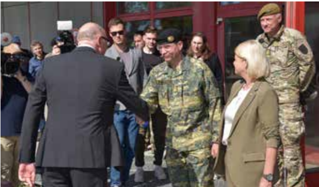
Internationale Übung TRIAS 25, Zusammentreffen mit Verteidigungsministern aus Österreich und Schweiz.