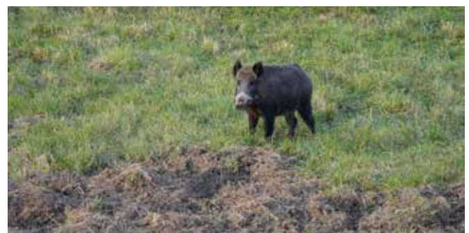
Begegnungen mit wilden Tieren gehört zum Dienstalltag dazu.

Der Truppenübungsplatz Allentsteig ist und bleibt ein Arbeitsumfeld, in dem militärische Raumnutzung und nachhaltige Bewirtschaftung im Einklang mit der Natur stehen. Das Militär beschreitet gemeinsam mit Jagd, Forst und Ökologie den Weg in die Zukunft.