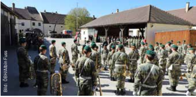
Das Ambiente im Meierhof eignete sich perfekt für den Festakt. Die Militärmusik sorgte für die musikalische Umrahmung.