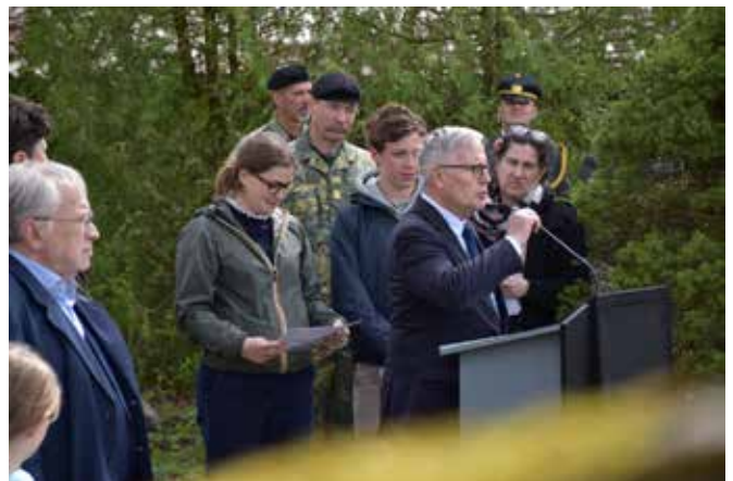
Feierlichkeiten anlässlich des Jahrestages der Befreiung des OFLAG XVII mit französischer Delegation.