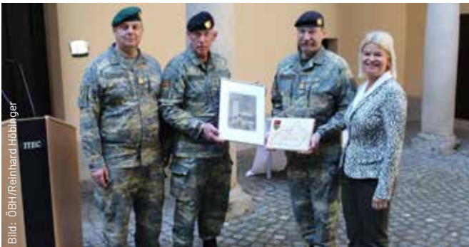
Der Vorgänger-Kommandant bekam als Andenken an seine Zeit am TÜPI A Erinnerungsgeschenke.