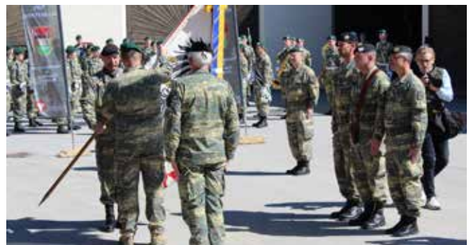
Eine Ära geht zu Ende. Mit der Rückgabe der Fahne endete seine Zeit am Truppenübungsplatz Allentsteig.