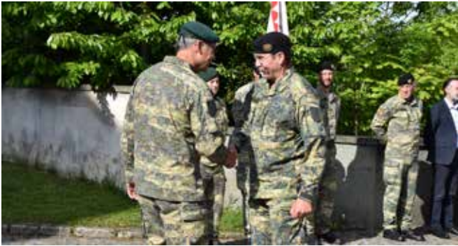
Klausur des Generalstabes am TÜPI A. Begrüßung des ranghöchsten Offiziers General Rudolf Striedinger vor dem Schloss.