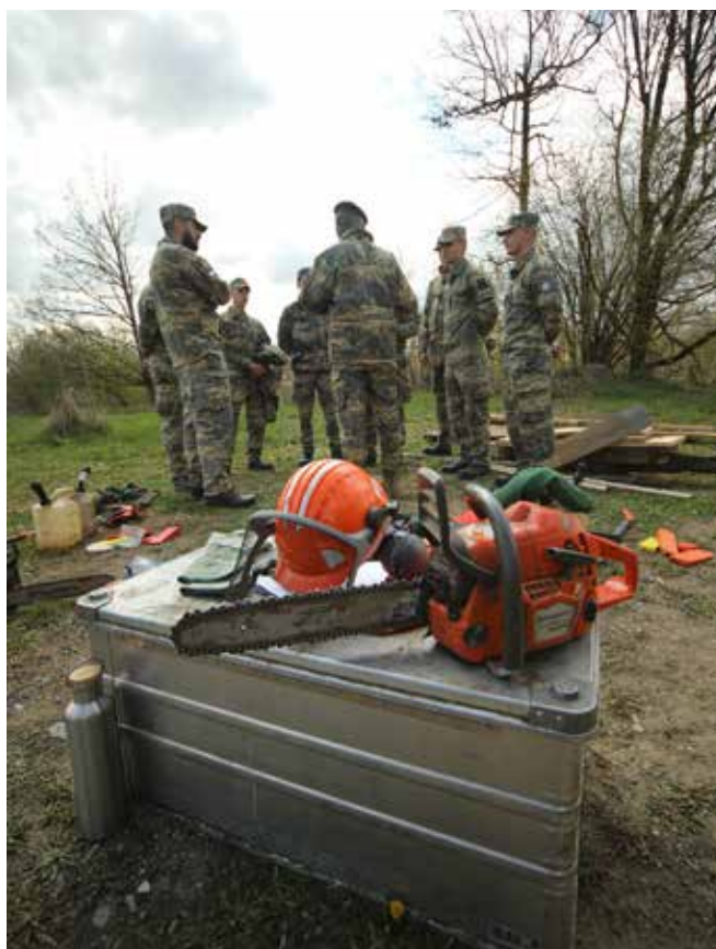
Zeigt den Umgang mit Spezialgerät und persönlicher Schutzausrüstung.

Sämtliche Versorgungs-, und Kommandoteile sowie die Ausbildungselemente wurden durch Milizsoldaten gestellt. Die Übungsleitung sowie die Unterstützung in den Bereichen Geräte- und Waffennachschub und die mediale Begleitung wurden durch Teile des Militärkommandos Niederösterreich sichergestellt. Die Übung verlief durchgehend unfallfrei.