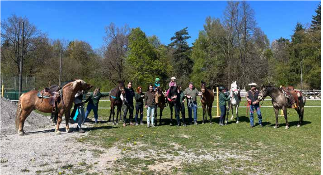
Das Team des HSV Sektion Pferdesport nahm Aufstellung. Mit den Pferden oft gar nicht so einfach.