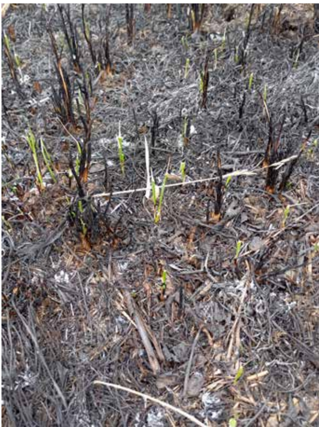
Nach dem gezielten Abbrennen gibt es rasch frische Triebe.

Zur Eindämmung der Afrikanischen Schweinepest (ASP) wird eine intensive Bejagung der Schwarzwildbestände forciert, um eine Ausbreitung in Österreich und die damit einhergehenden wirtschaftlichen Schäden hintanzuhalten. Die Ausübung der Jagd obliegt den fünf Berufsjägern, einem Berufsjägerlehrling und dem nebenberuflichen Jagdpersonal. Der Großteil des gewonnenen Wildbrets geht in den Wildbret-Handel und wird dort weiterveredelt. Ein Teil der gewonnenen Fleischerzeugnisse wird der Truppenküche zugeführt und dort verkocht.