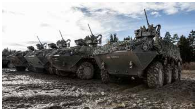
Der Pandur trotzte den Bodenverhältnissen.