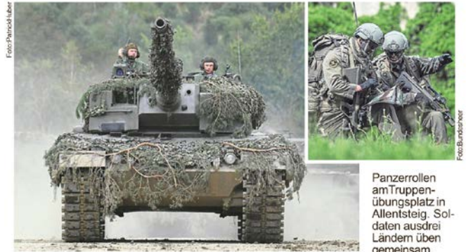
Panzerrollen am Truppenübungsplatz in Allentsteig. Soldaten aus drei Ländern üben gemeinsam.