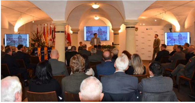
Bundesrat Stark bei seiner Ansprache im vollen Saal.