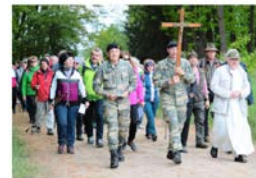
Vom Kreuzträger angeführt, marschierten 270 Menschen von Allentsteig nach Oberndorf.