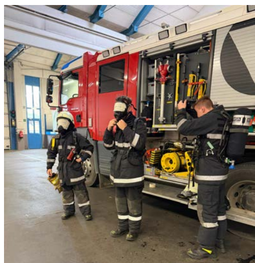
Die Abschlussübung musste mit Atemschutzgerät und sehr eingeschränkten Sichtverhältnissen absolviert werden.

Nach einer intensiven Ausbildungswoche zum Thema „schwerer Atemschutz“ beim Brandschutzzug am TÜPI Allentsteig haben die Grundwehriener des Einrückungstermines 09/25 ihre praktische Ausbildung erfolgreich abgeschlossen. Die Abschlussübung fand in der Atemschutzübungsstrecke der Freiwilligen Feuerwehr der Stadt Gmünd statt. Um die verschiedenen Übungsszenarien unter „Nullsicht“ meistern zu können, war es notwendig alle erlernten Fähigkeiten einzusetzen, was den vier Auszubildenden erfolgreich gelang. Drei erfahrene Ausbilder begleiteten die Rekruten während der gesamten Ausbildungszeit.