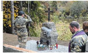
Zwei Jahre nach der Tragödie fand eine Gedenkfeier statt.

Anlässlich des Todestages fand am Ort des Unglücks nun eine militärische Gedenkfeier statt, bei der