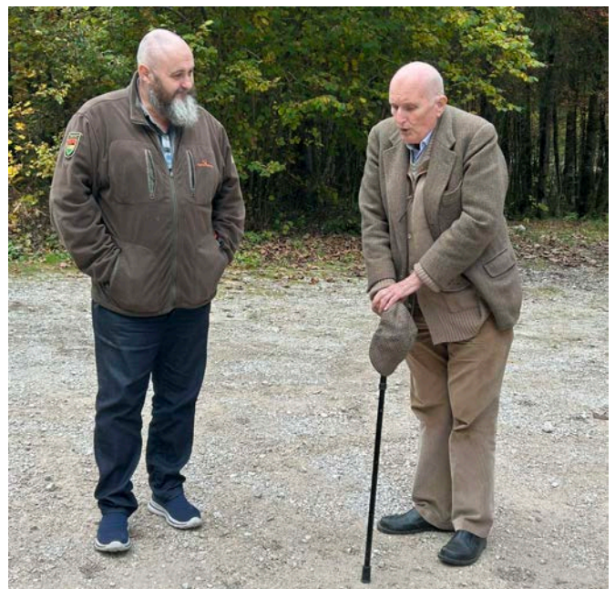
Ein echter Habsburger (re) erzählte historisch aus seiner Jugend.

Im Anschluss wurde die Rückverlegung angetreten und die gewonnenen Eindrücke konnten bei einer Stärkung im Gasthof Steegwirt in Steeg nachbesprochen werden.