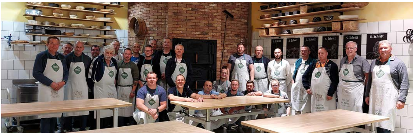
In der Backstube zeigten die Herren beim Backwarenformen ihre feinmotorischen Fähigkeiten .

In Laimbach wurde dann die Betreuungsfahrt bei den Schreiners nachbesprochen.