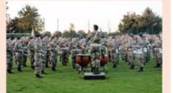
Spezialakt spielte die Militärkapelle.